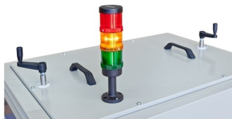
Possibilidade de ajuste de altura das resistências ao tapete e opção de colocação de torre de leds para visualização de estado