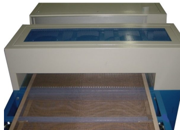
Pontes de ar frio para arrefecer peça disponíveis