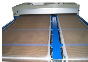
Possibilidade de equipar túnel com 2 tapetes