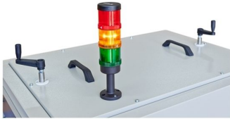
Possibilidade de ajuste de altura das resistências ao tapete e opção de colocação de torre de leds para visualização de estado