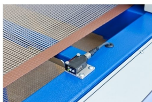
Possibilidade de equipar tunel com fotocelula de leitura de peça para economização de energia