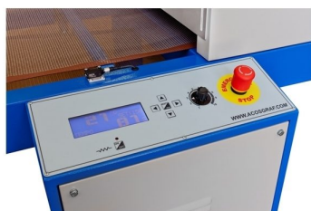
Opção equipar tunnel com painel electrónico com mais de 15 opções extras