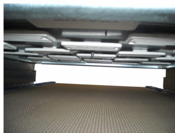
Distribuição perfeita das resistências sobre a largura do tapete