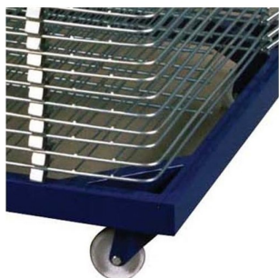
Rodízios em Nylon para fácil deslocação