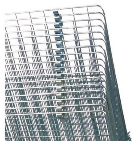
Construído com 50 grades zincadas de origem