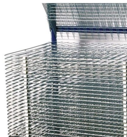
Espaçamento entre grades de 25 mm para colocação de material com espessuras