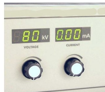
Display de voltagem e amperagem digital