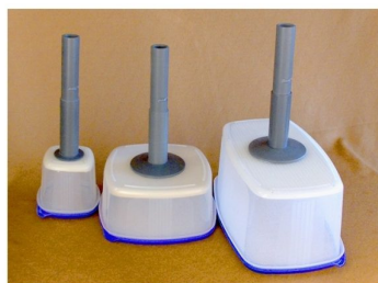
Possibilidade de ter 3 tamanhos de caixas de flocagem