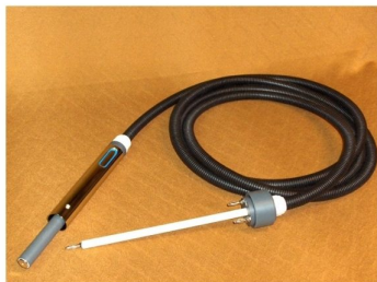
Pega com sensor indutivo de arranque de alta voltagem e com descarga automática para segurança do operador