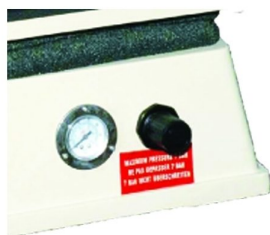
Cilindro pneumático de pressão de transferência com regulação de pressão