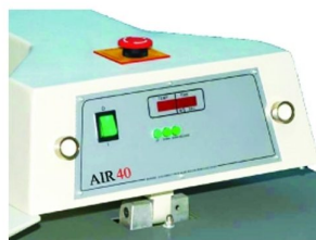
Controlador de temperatura e temporizador digital