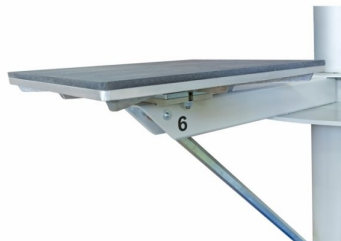
Possibilidade de trocar o prato inferior por tamanhos diversos