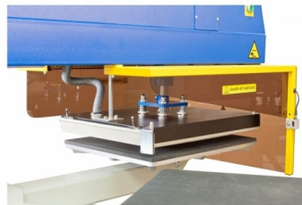
Fotocélulas de segurança nas cabeças de transfer para segurança do operador