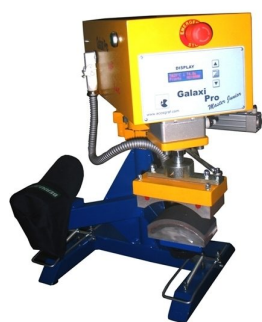
Modelos completamente automáticos de duas cabeças disponíveis