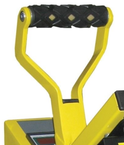
Desenho robusto para ser capaz de suportar forças de transfer altas