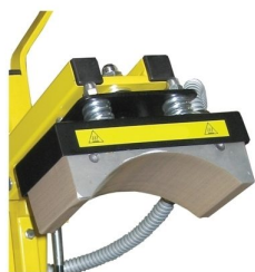
Cabeçal de prensagem com molas de compensação de pressão