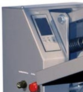
Controlador de temperatura digital