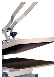
Abertura angular até 50 graus de inclinação