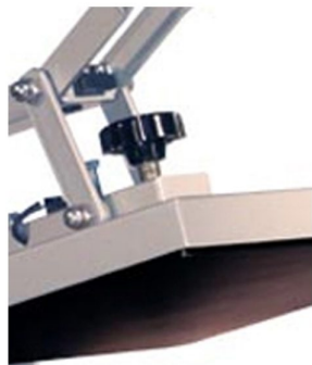
Controlo de pressão central