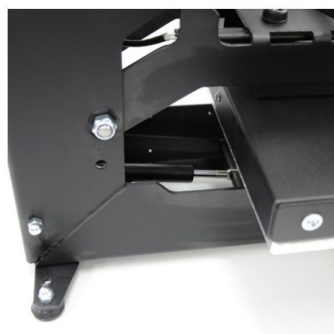
Shock absorber to help raising from heating plate