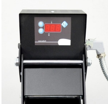
Temperature and timer digital controlled