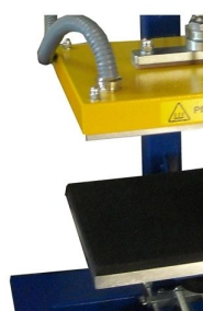
Curso de prensagem com 125 mm para prensagem em peças de elevado perfil