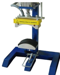
Possibilidade de colocar acessórios de transfer em bonés disponíveis