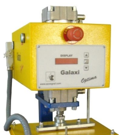
DISPLAY LCD em português