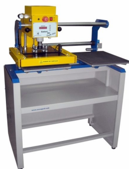
Outros modelos disponíveis com tamanhos de pratos de transfer maiores