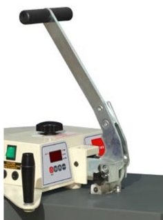
Descida do prato de calor vertical com manipulo de elevada resistencia