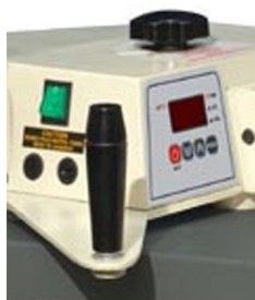
Controlador de temperatura e temporizador de prensagem digital