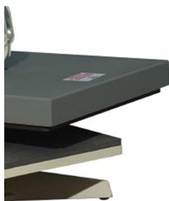
Abertura da prensa lateral para conforto do operador