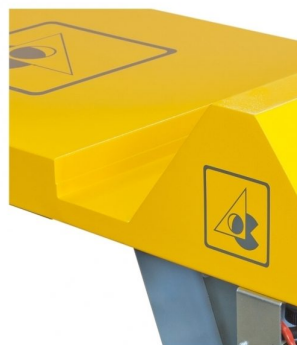
Desenho especial de baixo perfil para entrar em cabeçais de impressão