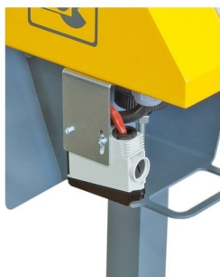
Pode ter opção de foto célula da leitura da paleta, start automático através do comando da máquina ou pedal