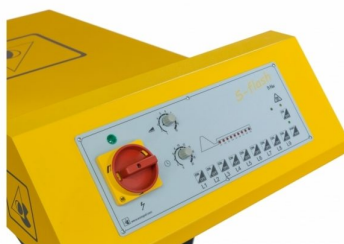
Painel de controlo com accionamento de lâmpadas independente