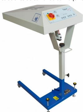
Secadores intercalares com outras formas disponíveis