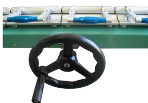
Ajuste de tensão da malha suave e perfeita para obter resultados excelentes