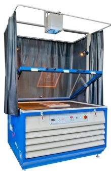
Máquinas de exposição de quadros disponíveis