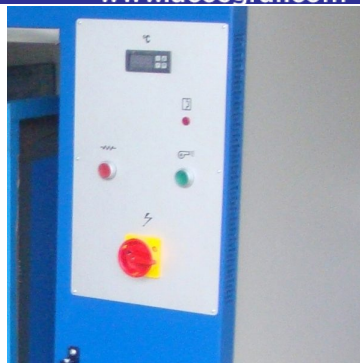
Controlador de temperatura com display digital