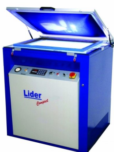
Diversos modelos de exposição de quadros disponíveis