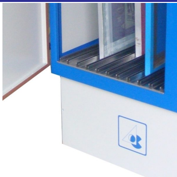
Slots para suporte de quadros c/ possibilidade de vários tamanhos