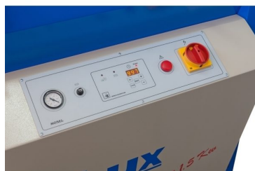
Control panel with vacuum pressure indicator; LCD display with memory saving