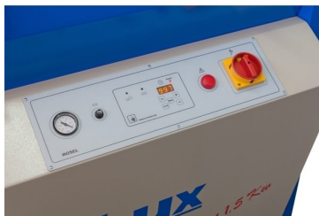
Control panel with vacuum pressure indicator; LCD display with memory saving