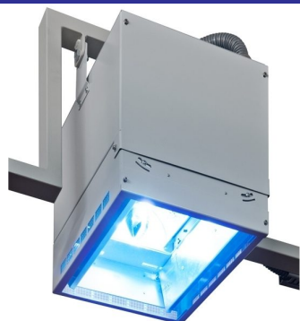
Fonte de luz metal/halógena