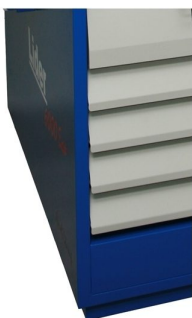
Estufa de secagem de quadros com ventilação forçada e controlador digital