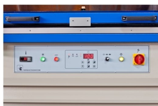
Programador digital com controlo de tempos de exposição capaz de memorizar 10 tempos de programação diferentes