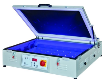
Modelos mais economicos disponiveis