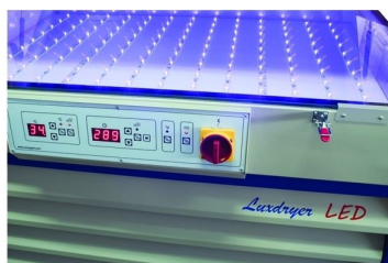
LEDs especiais de última geração para uma exposição do quadro rápida e precisa