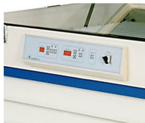
Painel LCD com capacidade de guardar até 10 programas