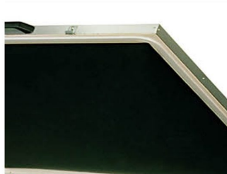
Perfeita moldagem do quadro