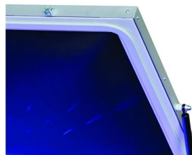
Perfeita moldagem do quadro