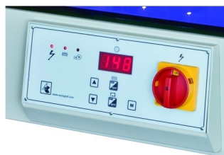
Painel de comando digital capaz de memorizar 10 tempos de programação diferentes