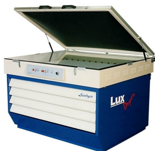
Modelos com equipados com estufa de secagem disponíveis