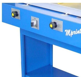
Registos micrométricos de impressão no tampo vácuo