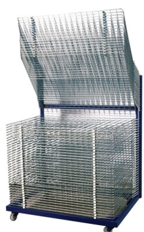
Estendais de secagem de impressões disponíveis em vários formatos