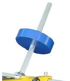
Contra - peso com ajuste de posição para equilíbrio do quadro de impressão