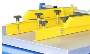
Suporte do quadro tareais ajustáveis a qualquer formato de quadro