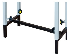
Possibilidade de ajuste da altura de trabalho