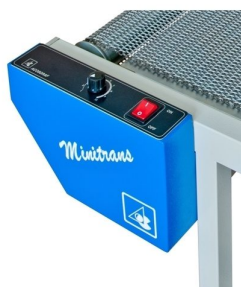
Tapete em metal para obter uma elevada resistência ao calor e com velocidade variável feita através de variação electrónica