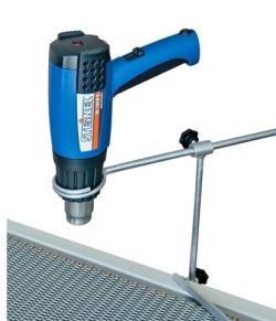
Equipado com pistola de ar quente como fonte de calor