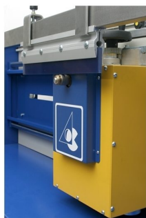
Possibilidade de afiar racklete comn formas diferentes (45 graus, redondo, 90 graus, etc..)