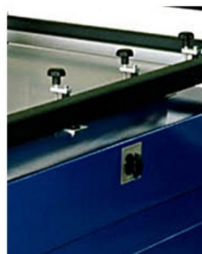
Registos micrométricos de impressão no tampo de vácuo