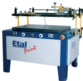
Outros modelos de máquinas de impressão manuais disponíveis