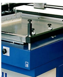
Possibilidade de imprimir objetos até 10 cm de altura