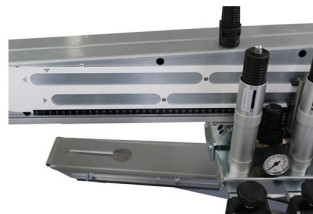
Limites de impressão ajustáveis independentes sem ser necessário ferramenta para ajuste