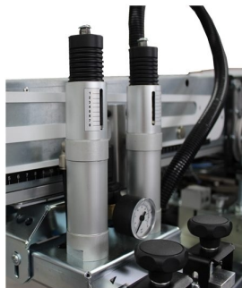
Pressão de impressão feito por 2 cilindros com ajuste individual