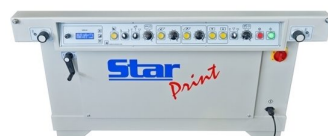
Máquina controlado por PLC e com raclagem/ contra raclagem; subir/descer