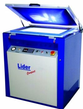
Prensas para queimar chapas OFFSET ou abrir quadros serigrafia disponíveis