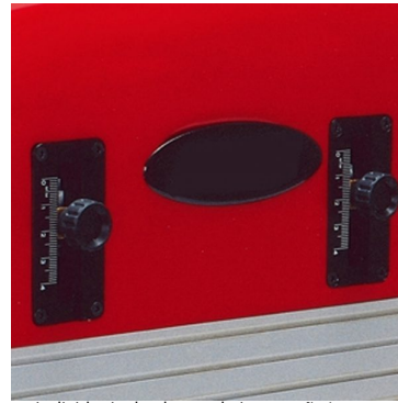
Ajuste individuais de alturas de impressão/ recuperação de tinta