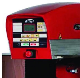
Painel LCD de 5 linhas com ajuste de alturas de impressão e recolha de tinta feita electronicamente por encoder