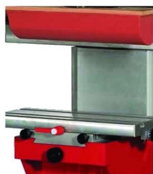
Possibilidade de impressão até objectos com 350 mm de altura