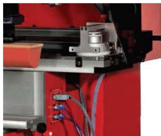
Varimento do clichê transversalmente para poder obter áreas de impressão consideráveis