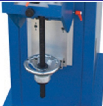
Mesa de impressão ajustável em altura