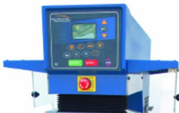
Painel LCD com ajuste de alturas de impressão feitas electronicamente