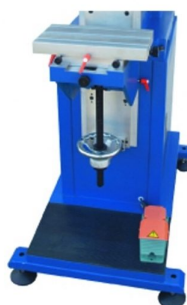
Pé da máquina com pedal START de série