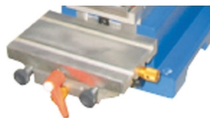
Ajuste micrométrico e regulação de altura da mesa de colocação de peça