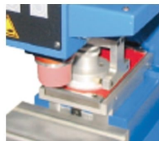
Sistema de impressão por tinteiro fechado