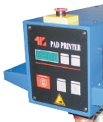
Painel LCD com possibilidades de diversas temporizações independentes