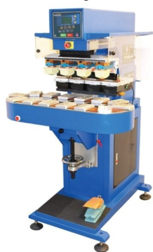
Máquinas com mais cores e com formatos de impressão maiores disponíveis