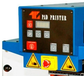
Painel com display contador de peças e paragem de emergência