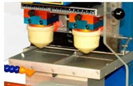
Sistema de impressão feito através de tinteiro aberto com possibilidade de impressão a 2 cores