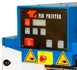
Painel com display contador de peças e paragem de emergência