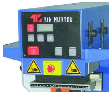
Painel LCD com contador parcial e total de peças e ajuste de pause entre impressões