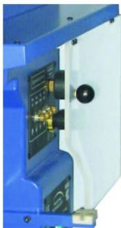
Velocidades de impressão independentes e reguláveis (avanço; recuo; subir, descer e pressão de régua raspadora);