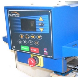
Painel LCD com ajuste de alturas de impressão feitas electronicamente