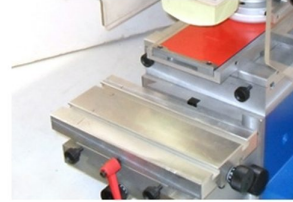
Ajuste micrométricos e de altura da mesa de colocação de peça