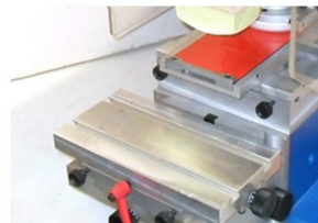
Ajuste micrométricos e de altura da mesa de colocação de peça