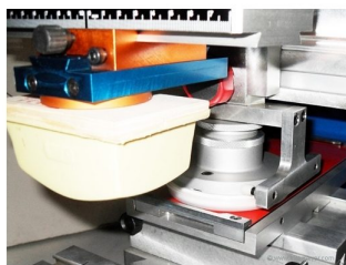
Sistema de impressão por tinteiro fechado