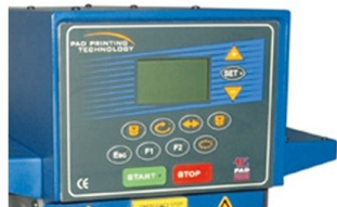
Painel LCD com ajuste electrónico de alturas de impressão e recolha de tinta