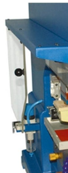
Portas laterais com micro suite de paragem de emergência