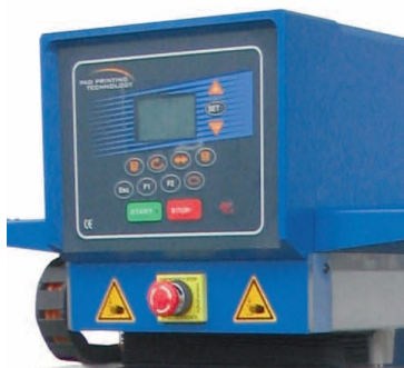
Painel de comandos com LCD