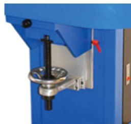
Mesa de impressão ajustável em altura