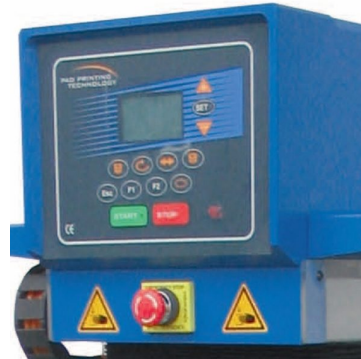
Painel de comando com LCD