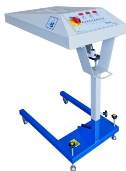
Secadores intercalares de impressão disponíveis