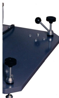
Pés com ajuste de altura para o melhor nivelamento