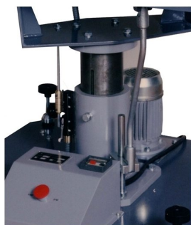
Motor vibratório de alto rendimento c/ botoneira de paragem de emergência