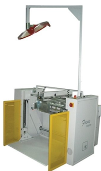
Stacker para máquinas de altas produções disponíveis