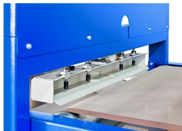
Cilindros de aperto de folha com 4 posições reguláveis