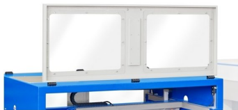
Coberturas de proteção com fim de cursos de segurança