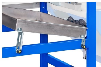
Mesa de receção de folha com ajustes de inclinação e altura