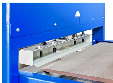
Cilindros de aperto de folha com 4 posições reguláveis