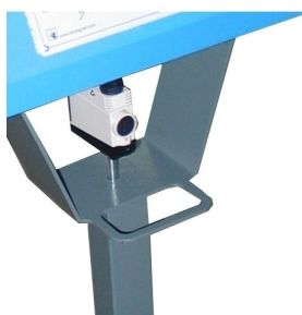
Pode ter opção de foto célula da leitura da palete, start automático através do comando da máquina ou pedal