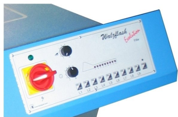
Painel de controlo com accionamento de lâmpadas independente