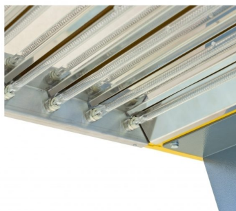
Suporte de lampada de remoção rápida