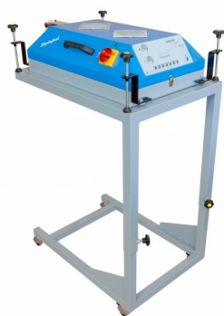
Secadores intercalares com outras formas disponíveis